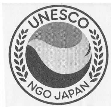
諏訪ユネスコ協会